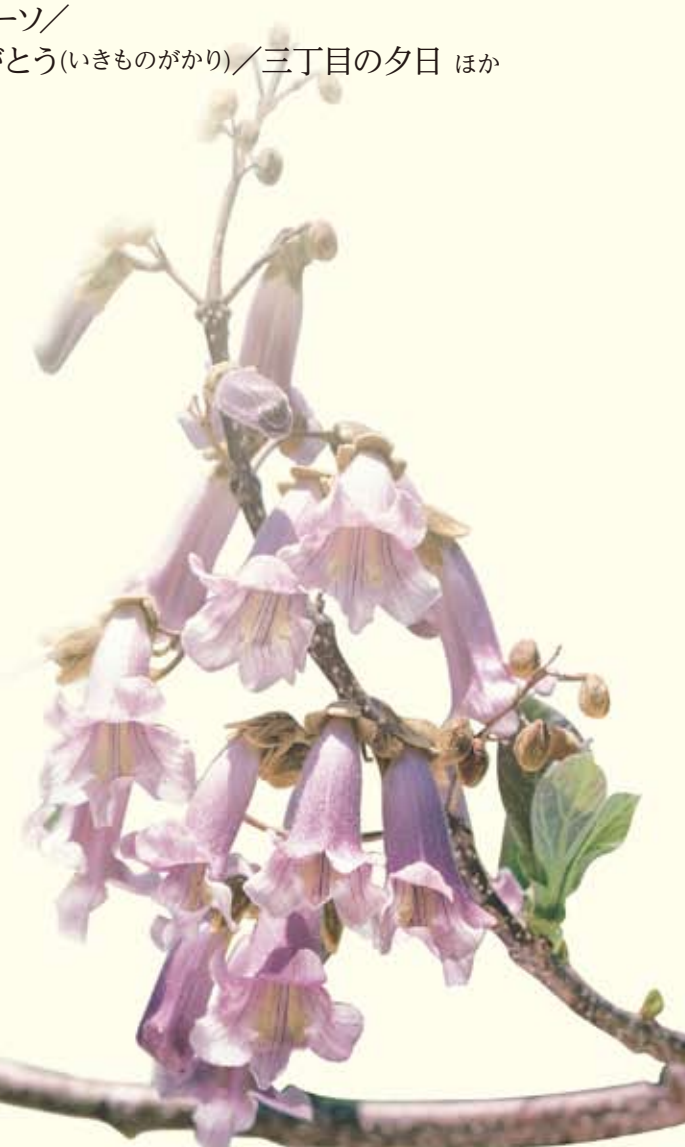
桐の花(岩手県宮古市)